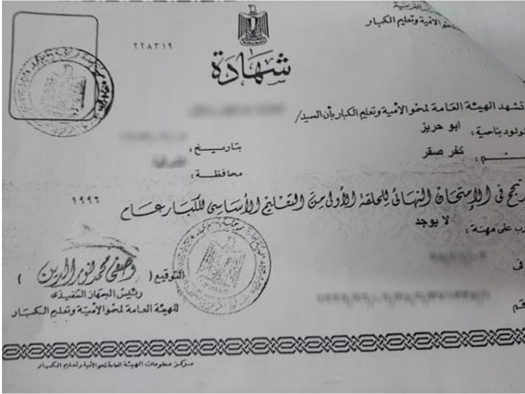
صورة (2) إصدار قديم لشهادة محو الأمية تعود لسنة 1990م.