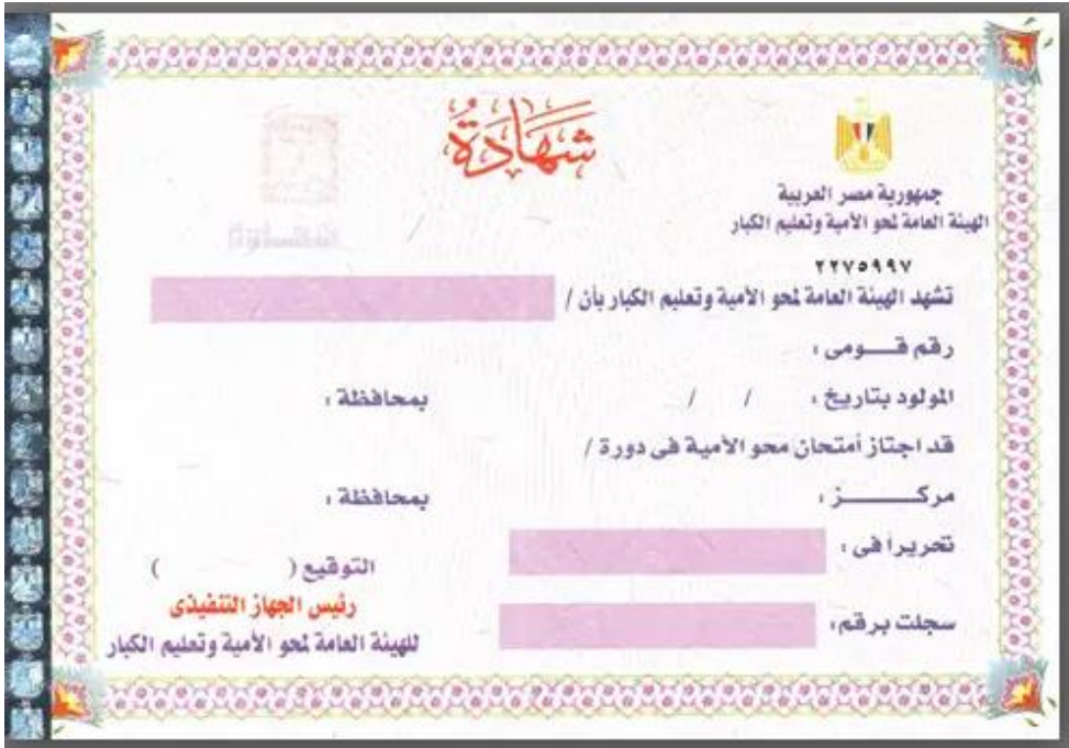
صورة (1) نموذج لإصدار حديث لشهادة محو الأمية

وقد تنبتهت الدولة لذلك وعملت على أن تكون الاختبارات في مواعيد محددة (دورات) على مدار العام بشكل ربع سنوي (يناير، أبريل، يوليو، أكتوبر) وتُعقد في مراكز المحافظات فقط وقامت بتشديد الرقابة على المُمتحنين وجعل الشهادات (ممكنة / رقمية) وبها علامة مائية خاصة بالهيئة 37 بدلاً من الشهادة الورقية القديمة 38 ؛ لجعل تزويرها صعباً. وعملت على حصر أعداد الأُميين في كل محافظة ومدينة وقرية في قاعدة بيانات توزع على القائمين على عملية محو الأمية، كما عملت على قصر إصدار الشهادات على المركز الرئيسي للهيئة في القاهرة دون غيره من فروع الهيئة. ويُشترط على من يجتاز اختبار محو الأمية في أن يتم استكتابه مرة أخرى عند تسلمه الشهادة؛ للتأكد من أنه نفس الشخص الذي اجتاز الاختبار. كما أغلقت الدولة حوالي 120 جمعية أهلية ثبت تورطها في منح شهادات محو أمية لأشخاص أميين دون اجتيازهم اختبارات أو تعليمهم.